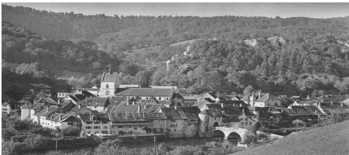
Saint-Ursanne. — Vue prise du sud.